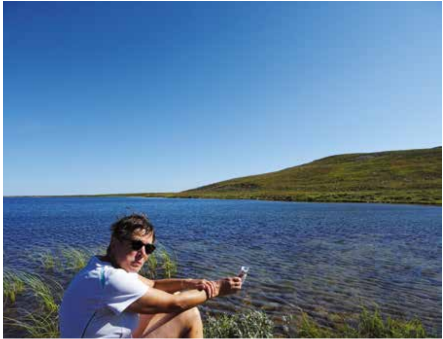
Vilvoitteluhetki pienen Pyhäjärven rannalla.

Veden haku ja pesujen hoitaminen on hidasta puuhaa. Pitää katsoa, ettei likaa kohtaa, josta joku ottaa juomavettä ja kahlailu tuntemattomassa, kylmässä purossa on vähintäänkin mielenkiintoista. Riittävä virtaus vedessä takaa – yleensä – puhtaan juomaveden, poikkeuksia lukuun ottamatta! Yhteispelillä kaikki sujuu.