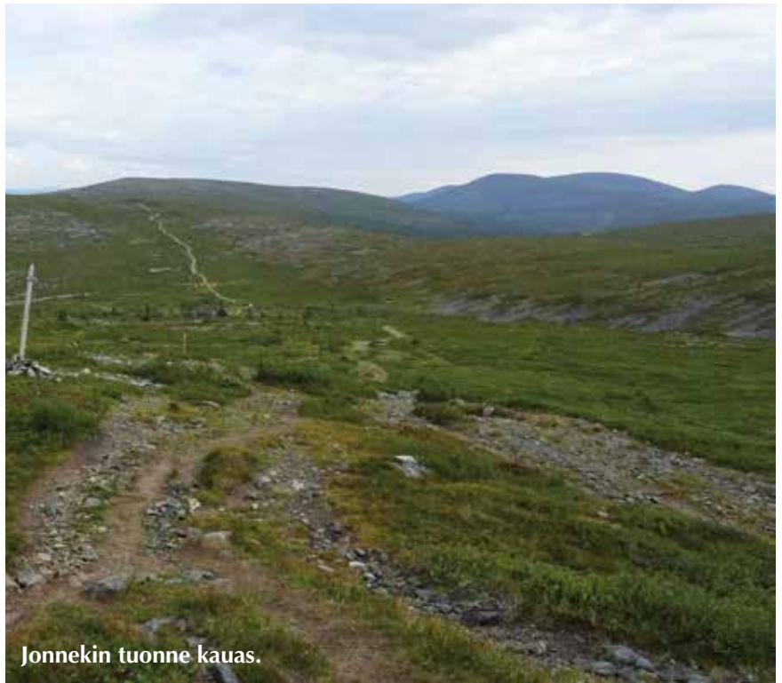
Jonnekin tuonne kauas.

Nukumme yleensä aamuisin melko pitkään, kumpikaan ei ole aamuvirkku. Rauhallisesti aamupala ja matkaan ennen puolta päivää. Parin-kolmen tunnin jälkeen ruokailu. Viimeinen telttapaikka oli Nammalakurussa. Siellä oli varaustuvassakin ihmisiä ja toisella puolella tuvassa myös. Silti oli mukava olla hetken sisällä iltapalaa syömässä. Meillä tuohon 55 km:n matkaan meni 4,5 vuorokautta, mutta täällä tapasimme nuoret naiset, jotka viilettivät sen viikonlopussa. Kukin tyyliään. Viimeisen päivän sää olikin sitten tuulista ja sadekin ropisi välillä. Aika pitkältä tuntui matka hotelli Pallakselle. Taivaskero on siinä